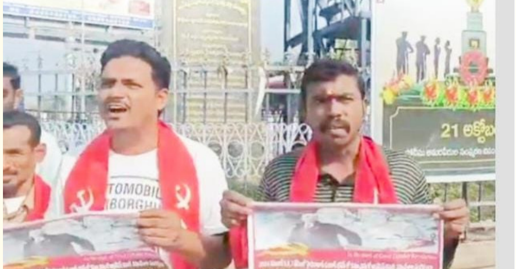
విచ్చు పెడుతూ హత్యలకు ప్రేరేపిస్తుందని, విద్య,వైద్యం గిస్తుందని ఆయన విమర్శించారు.ఈ కార్యక్రమంలో ఎం.సి.బి. తదితర రంగాలకు సంబంధించి కార్పొరేట్ వ్యక్తులకు అప్పు ఐయ్య. నాయకులు, కార్యకర్తలు, తదితరులు పాల్గొన్నారు.