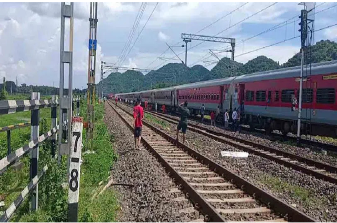
దిమ్మెలు, ఇసుక దిమ్మెలు ఉన్నాయి. ఇలాంటి ఘటనలు తెలంగాణ రాష్ట్రాల్లో ఈ ప్రమాదాలు జరిగినట్లు రైల్వే శాఖ అధికారులు వివరించారు. ఇక జూన్ 2023 నుంచి ఇప్పటి వరకూ ఈ తరహా ఘటనలు 24 జరిగినట్లు తెలిపారు.

దేశంలో రైలు ప్రమాదాలకు దారి తీసేలా కుట్రపూరిత ప్రయత్నాలు అందోళన కలిగిస్తున్నాయి. ట్రాక్పై గ్యాస్ సిలిండర్లు, ఇసుక పట్టీలు ఉంచాతూ రైల్వే పట్టాలు తప్పించేందుకు కుట్రలు పన్నుతున్నారు. ఉత్తరప్రదేశ్, గుజరాత్ సహా పలు రాష్ట్రాల్లో ఇప్పటికే ఇలాంటివి అనేక ఘటనలు వెలుగుచూశాయి. తాజాగా మరో కుట్ర బయటపడింది. ఉత్తరప్రదేశ్లోని మలిహాబాద్ రైల్వే స్టేషన్ సమీపంలో ట్రాక్పై దుండగులు చెక్క దిమ్మెను ఉంచారు. అక్టోబర్ 24న ఈ ఘటన చోటు చేసుకుంది. ఆ సమయంలో 14236 నంబర్ గల బర్రేలీ - వారణాసి ఎక్స్ప్రెస్ రైలు పైలట్ ట్రాక్పై ఉన్న 6 కిలోల కంటే ఎక్కువ బరువున్న రెండు అడుగుల పొడవైన చెక్క దిమ్మెను గుర్తించారు. వెంటనే అత్యవసర డ్రైవ్ వేశారు. దీంతో పెను ప్రమాదం తప్పింది. ఈ ఘటనతో దాదాపు రెండు గంటల పాటు ఆ మార్గంలో రైల్వే రాకపోకలు నిలిచిపోయాయి. రంగంలోకి దిగిన అధికారులు ట్రాక్పై ఉన్న వాటిని తొలగించారు. ఆ తర్వాత భద్రతా తనిఖీల అనంతరం రైల్వే రాకపోకలను పునరుద్ధరించారు. ఈ ఘటనపై రైల్వే ప్రొటెక్షన్ ఫోర్స్ ఎఫ్ఐఆర్ నమోదు చేసి దర్యాప్తు చేపట్టింది. ఇటీవలే దేశవ్యాప్తంగా రైల్వే పట్టాలు తప్పించేందుకు అనేక కుట్రలు జరిగిన విషయం తెలిసిందే. రైలు ట్రాక్పై వివిధ రకాల అడ్డంకులు అధికారులు గుర్తించారు. వీటిలో ఎల్పీజీ సిలిండర్లు, సైకిళ్లు, ట్రాక్టర్లు, ఇసుక రాడ్లు, సిమెంట్