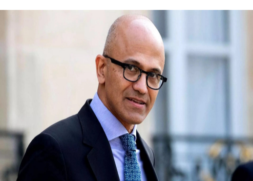
ఆర్థిక సంవత్సరంలో మైక్రోసాఫ్ట్ గణనీయమైన వృద్ధి సాధించింది. దీంతో కంపెనీ షేర్లు 31.2 శాతం అభివృద్ధి అయింది. అలాగే మైక్రోసాఫ్ట్ మార్కెట్ విలువ 3 ట్రిలియన్ డాలర్లు దాటింది. దీంతో సత్య నాదెళ్ల స్టాక్ అవార్డులు 38 మిలియన్ డాలర్ల నుంచి 71 మిలియన్ డాలర్లకు పెరిగాయి. కృత్రిమే మేధ(ఏఐ) రేసులో రాజీనామా చేయకుండా కంపెనీ

న్యూఢిల్లీ : సత్యనాదెళ్ల. ప్రముఖ టెక్ సంస్థ మైక్రోసాఫ్ట్ సీఈవో. దాదాపు ఐదేళ్లుగా ఆయన ఈ హోదాలో కొనసాగుతున్నారు. కంపెనీ సీఈవో కావడానికి ఎంత శ్రమించారో.. సీఈవోగా ఇప్పుడు కంపెనీ వృద్ధికి అంతకన్నా రెంట్జింప్రామాణంలో పనిచేస్తున్నారు. అయితే ఇటీవల తెచ్చిన చాన్సెస్లో క్యాన్సర్ ఇబ్బంది పడినా.. బోర్డు సత్యనాదెళ్లపై పూర్తి విశ్వాసం వ్యక్తం చేసింది. దీంతో ప్రస్తుతం సీఈవోగా ఆయనే కొనసాగుతున్నారు. తాజాగా సత్యనాదెళ్ల జీతం పెరిగింది. 2024 ఆర్థిక సంవత్సరంలో ఆయన 79.1 మిలియన్ డాలర్ల వేతనం అందుకోనున్నారు. అంటే మన భారతీయ కర్నెస్లో రూ.664 కోట్లు అన్నమాట ఈ విషయాన్ని కంపెనీ తన రెగ్యులేటరీ ఫైలింగ్లో పేర్కొంది. 2023 ఆర్థిక సంవత్సరంలో సత్యనాదెళ్ల వేతనం 48.5 మిలియన్ డాలర్లు. భారత కర్నెస్లో రూ.407 కోట్లు. ఈ ఏడాది సత్య నాదెళ్ల వేతనం 63 శాతం పెరిగింది. దీతో ఆయన 79.1 మిలియన్ డాలర్లు. భారత కర్నెస్లో రూ.667 కోట్లు అందుకోనున్నారు. గత జూన్తో ముగిసిన